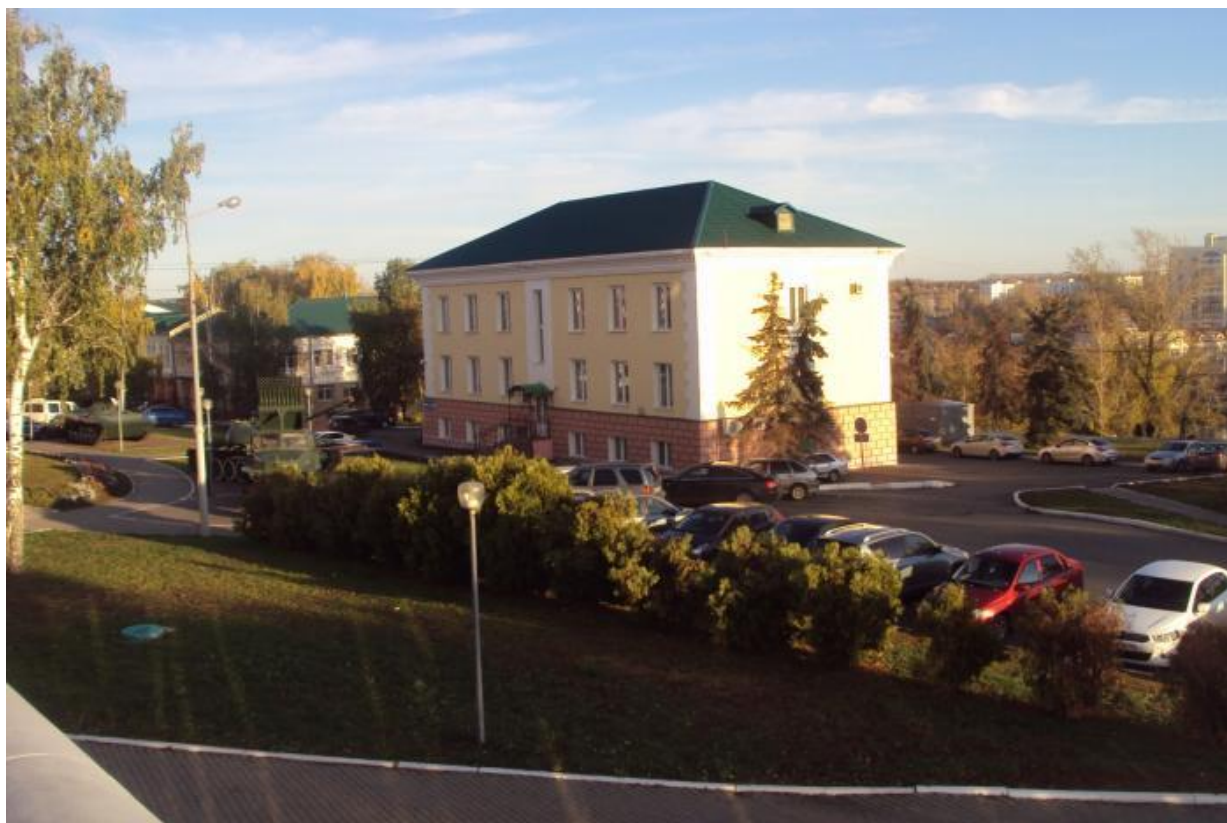
Дом по адресу: Советская, 34, где М.М. Бахтин жил в 1945–1959 гг. http://photos.wikimapia.org/p/00/07/56/13/13_big.jpg

Во второй раз Бахтин приехал в Саранск в осень 1945 г. «Сразу же по приезде... Бахтиным была предоставлена комната в институтском доме в центре города. ...дом этот в прошлом представлял собой один из корпусов Саранской уездной тюрьмы. После ликвидации тюрьмы корпус переоборудовали в жилой дом для преподавателей пединститута», – свидетельствует Конкин [6, с. 258].