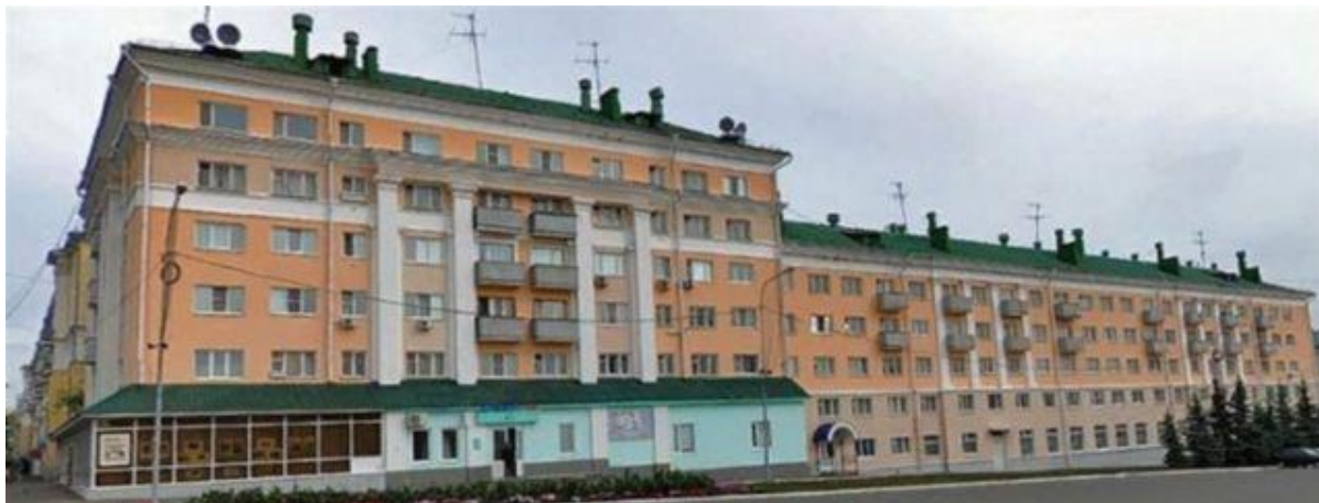
Ул. Советская, 33. URL:

помещениями на первом этаже. В 1966 г. в одном из них был открыт старейший книжный магазин Саранска, в другой была переведена картинная галерея им. Ф.В. Сычкова. Михаил Михайлович посещал галерею в 1960 г., когда она находилась в другом помещении, расположенном также рядом с его домом [см.: 3]. Нам неизвестно, посещал ли Бахтин магазин «Книжный мир» (поскольку в последние годы в Саранске он был уже тяжело болен), но это здание хорошо просматривалось из его окна.