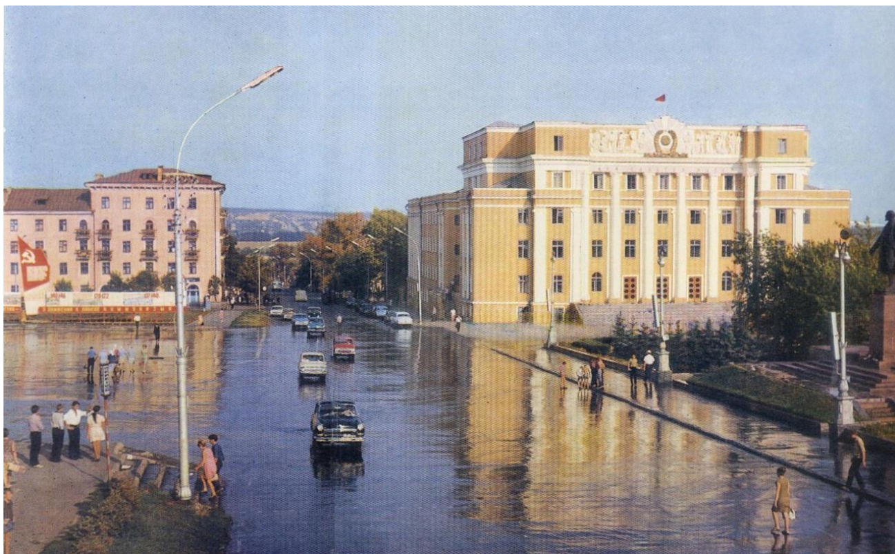
Дом по адресу: Советская, 31, где М.М. Бахтин жил в 1959–1969 гг. Справа от него – Дом Советов (Советская, 26).

Первая мемориальная доска на этом здании была торжественно открыта в 1979 г., спустя четыре года после смерти Бахтина. Инициаторами установления доски стали его коллеги – ученые Мордовского университета [см.: 5, с. 242]. Недавно, после ремонта здания на нем была установлена новая мемориальная доска, посвященная мыслителю (с тем же текстом).