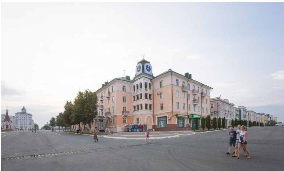
«Дом с часами». Ул. Советская, 47. URL: http://wikimapia.org/4370248/ru/Советская-ул-47#/photo/3587062

Старейшим архитектурным памятником Советской площади и в целом Саранска является ныне здание городской администрации, построенное в 1915 г. по проекту инженера П. Бенфельдта как многофункциональный «торгово-развлекательно-образовательный комплекс» начала XX в. До революции здесь одновременно размещались купеческий клуб с бильярдной и карточной, магазины и учительская семинария. Трехэтажное здание, возведенное в «кирпичном стиле», является памятником архитектуры регионального значения. Очевидно, что данный объект был хорошо знаком Бахтину. Этому способствовало его месторасположение – совсем рядом и с первой, и со второй его квартирами, из окон которых был виден его внушительный кирпичный объем.