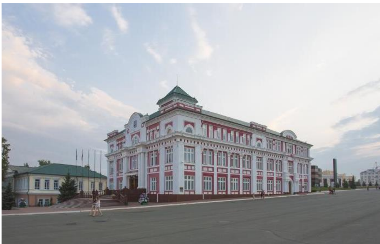
Здание администрации городского округа Саранск (Советская, 30). URL: https://wikimapia.org/953005/ru/Администрация-городского-округа-Саранск#/photo/3587067

Из окна своей квартиры Бахтин мог видеть главные архитектурные доминанты, формирующие ансамбль центральной площади столицы Мордовии. Одну из них – Дом Советов философ упоминает в своем интервью (называя его Домом правительства). Это самый монументальный и презентабельный архитектурный объект сталинской эпохи в столице Мордовии, возведенный в 1940 г. в стиле советского неоклассицизма по проекту молодого ленинградского архитектора И.А. Меерзона. Мощный объем сооружения состоит из двух П-образных корпусов – шести- и четырехэтажного, образующих красивый внутренний двор. Торжественен главный пятиэтажный фасад правительственного здания, декорированный полуколоннами и пилястрами гигантского ордера, охватывающими в центре сразу четыре этажа. Широкий лестничный марш и строгий венчающий карниз усиливают образное решение сооружения. Завершает фасад барельефный фриз «Дружба народов», выполненный скульптором И.Н. Абрамовым с группой студентов Пензенского художественного училища. Интересно решен боковой фасад здания, выходящий на площадь: в цокольном этаже Меерзон запроектировал правительственную трибуну, на которую можно было выйти непосредственно из помещения корпуса.