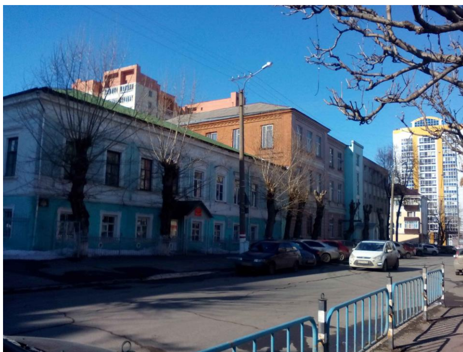
Университетский корпус № 5 (Володарского, 22).

Недалеко от дома Бахтина на улицах Володарского и Советской и сегодня расположены здания, функция которых не изменилась с 1960-х гг. Это старейшие университетские корпуса, в которых ученый мог читать лекции или просто бывать на общеуниверситетских мероприятиях (заседаниях, конференциях и т. д.).